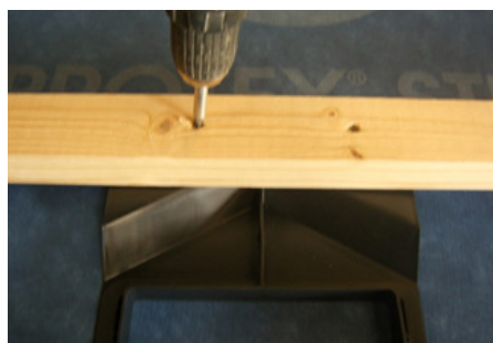
Der skrues 4 max 45 mm. lange skruer igennem lægten af undertagskraven ca. 15 mm. fra overkant af lægten. Ribbene på undersiden af kraven sikrer, at der ikke kan komme kontakt mellem undertag og skruer.