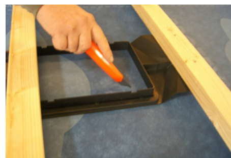
Der skæres et snit fra hjørne til hjørne.