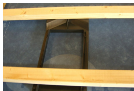
Det øverste element med pakningen på undersiden, monteret imellem underlægter og undertag.