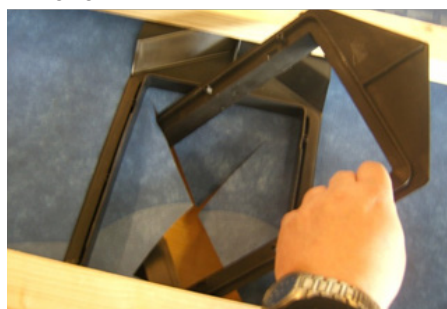
Det nederste element puttes ud gennem hullet, klikkes fast og skrues i skruehullerne med de 4 medfølgende 35 mm skruer.